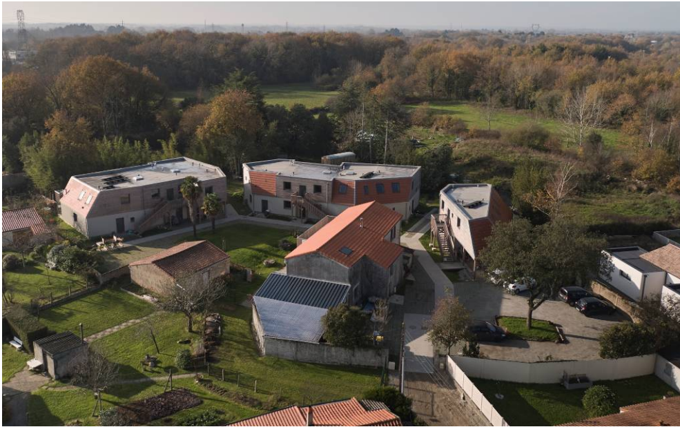
Vue d'ensemble du pré commun

Si vous êtes intéressé prenez contact avec nous dans un premier temps par email : contact@leprecommun.fr en nous communiquant vos coordonnées et vos motivations pour rejoindre notre coopérative. Nous vous recontacterons au plus vite.