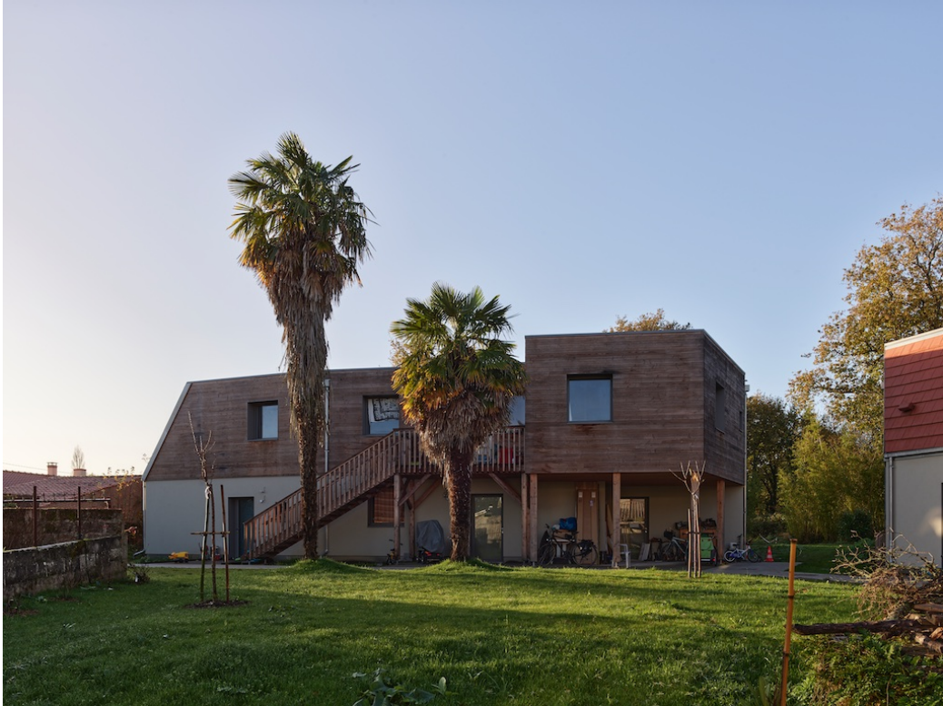
Vue Maisonnée 3