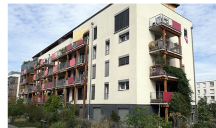
Le Village Vertical, Villeurbanne

À l'échelle de l'immeuble s'organisent la gestion des déchets, la récupération des eaux de pluie, l'autopartage... Les habitants se groupent pour acheter ensemble des produits bio ou de l'électricité d'origine renouvelable.